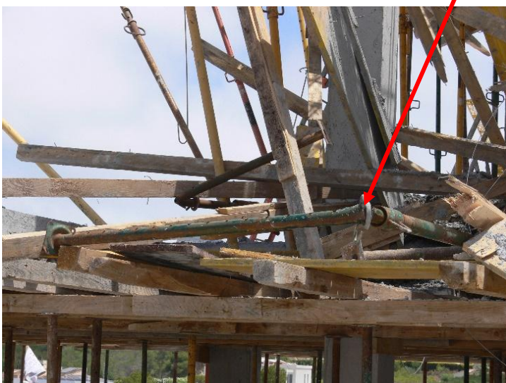
Fotografia 6. Diverses vistes de l'encofrat de la llosa després de col·lapsar. (INVASSAT)