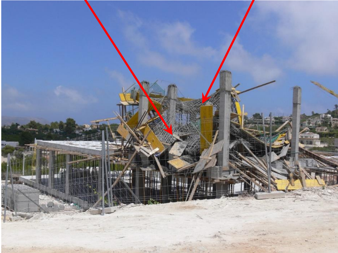
Fotografia 5. Vista general de la llosa armada col·lapsada mentre es formigonava.

Armadura de la llosa sobre la qual van quedar retinguts dos treballadors després de la sol·licitud de l'encofrat.