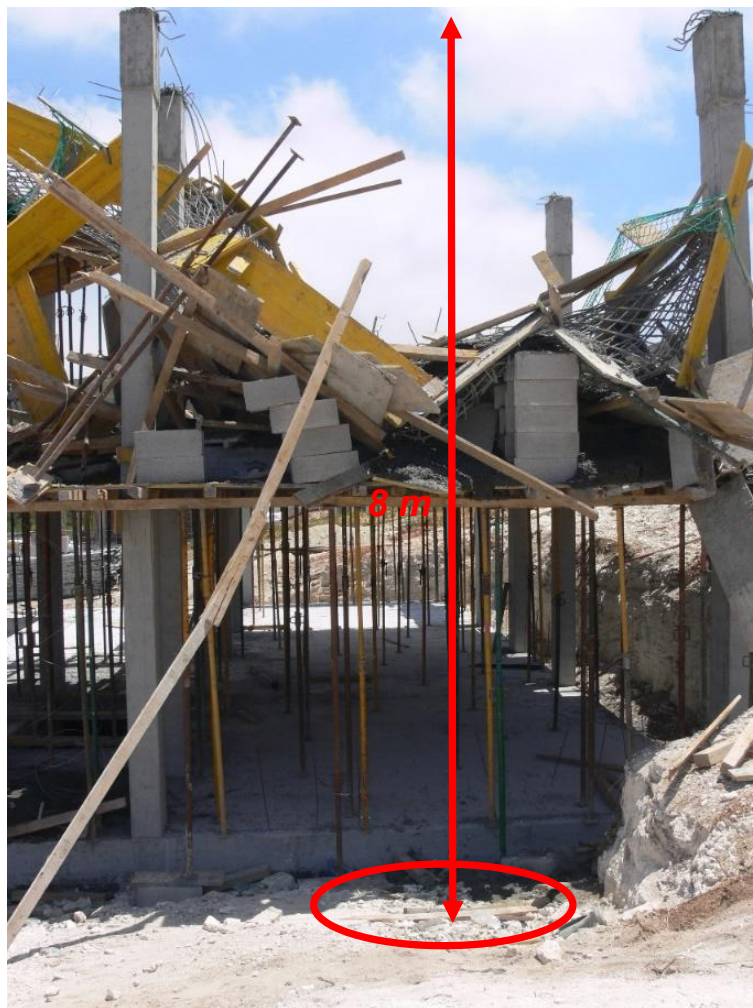
Fotografia 4. Lloc a on cau el treballador accidentat des d'uns 8 metres d'altura. (INVASSAT)