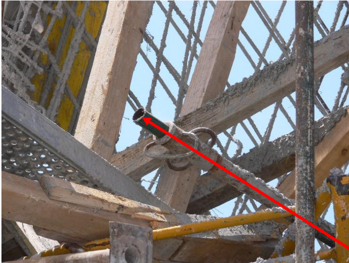
Detall del trencament de puntals emprats en l'encofrat de la llosa inclinada de la coberta.