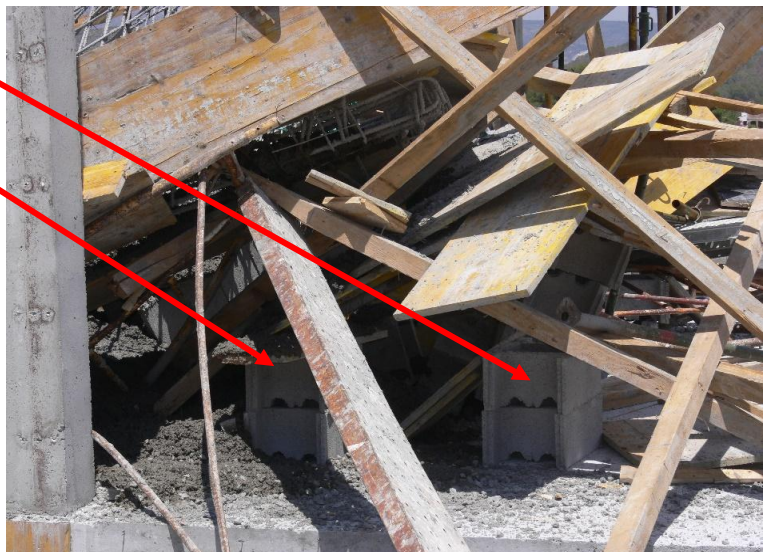
Fotografia 2. Dos vistes detallades de la suplementació dels puntals que no arribaven a l'encofrat.

L'armadura de la llosa la van muntar els mateixos treballadors sobre l'empostat de l'encofrat.