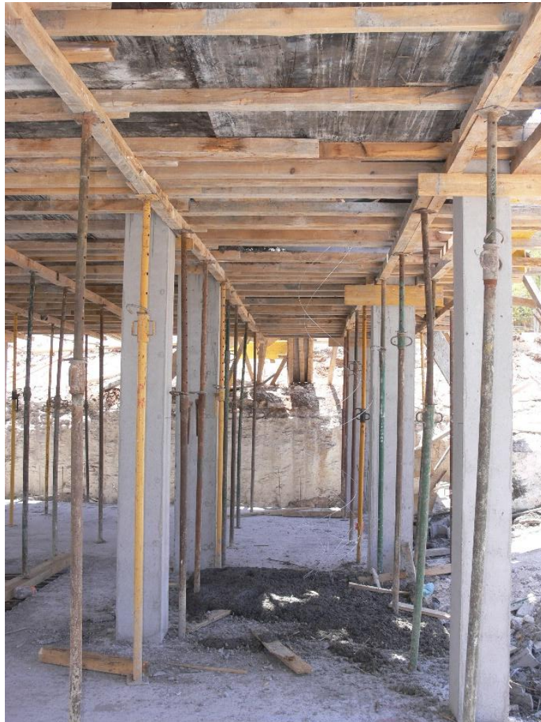
Fotografia 3. Encofrat horitzontal alleugerit amb revoltó del primer forjat, amb una altura estàndard de 2,80 metres. (INVASSAT)

Per a la formigonada de la llosa empraven una bomba de formigonada que estava situada en el carrer, i l'operador d'esta bomba estava situat sobre el forjat de la primera planta, manejant-la mitjançant un comandament sense fil. Mentre que sobre l'armadura de la llosa es trobaven els tres treballadors que abocaven el formigó, l'estenien, vibraven i anivellaven. Igualment manifesten els entrevistats que el procés de formigonada de la llosa citada va començar a les 8:00 del matí, i s'havien abocat fins al moment dos tancs de formigó (uns 15 m 3 de formigó) i quedava per abocar 1 m 3 aproximadament.