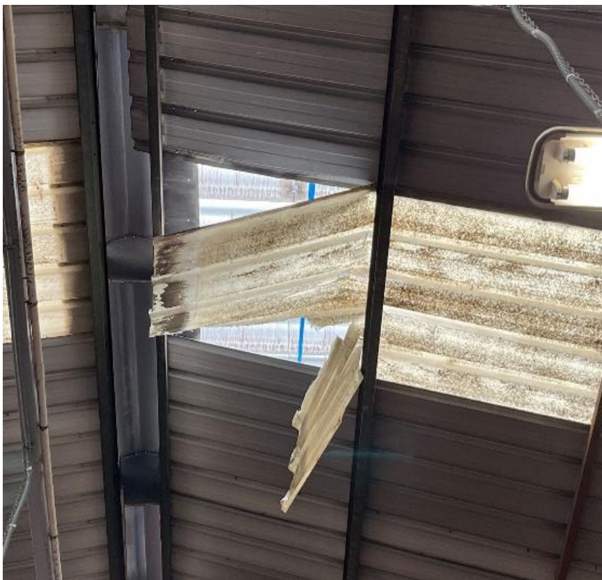
Fotografía 4. Vista por debajo de la placa translúcida rota en un accidente de trabajo similar al descrito en esta FIA.