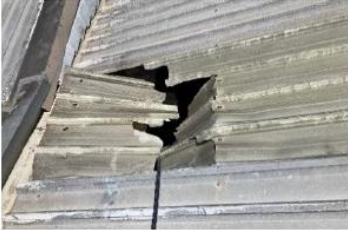
Fotografía 3. Vista por arriba de la placa translúcida rota en un accidente de trabajo similar al descrito en esta FIA.