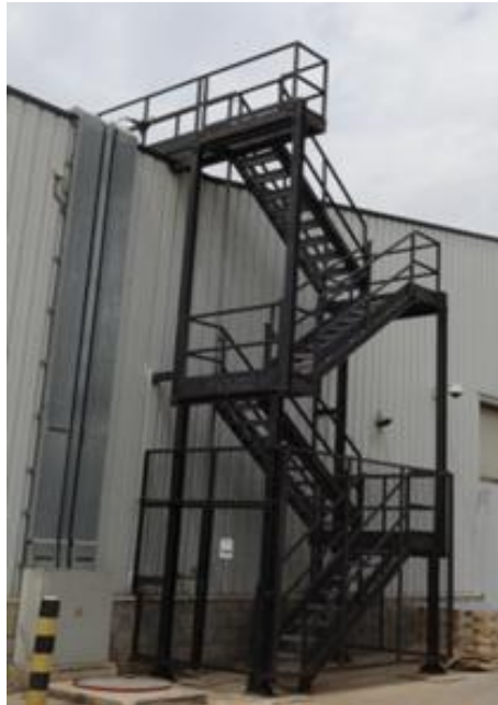
Fotografía 5. Escalera fija para acceder a la cubierta de una nave industrial.