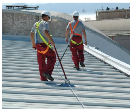
Fotografía 9. Sistema de protección individual de caídas en altura. (Instituto Nacional de Seguridad y Salud en el Trabajo (España), 2019)

Y, más en concreto, se recomienda hacer una lectura detenida del folleto Trabajar sin caídas: Equipos de protección individual contra caídas de altura .