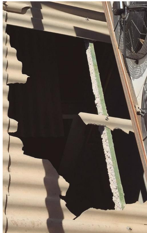
Fotografía 10. Cubierta de fibrocemento rota al ser pisada por un trabajador. (Instituto Nacional de Seguridad y Salud en el Trabajo (España), 2019)

Los trabajos de mantenimiento y reparación que impliquen riesgo de desprendimiento de fibras de amianto por la existencia y proximidad de materiales de amianto entran dentro del ámbito de aplicación del Real Decreto 396/2006 sobre trabajos con exposición al amianto. Estos trabajos solo podrán realizarse por empresa RERA y, de forma generalizada, requerirán la aprobación de un plan de trabajo específico por la autoridad laboral.