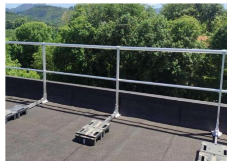
Fotografía 7. Borde perimetral de una cubierta protegido con barandillas.