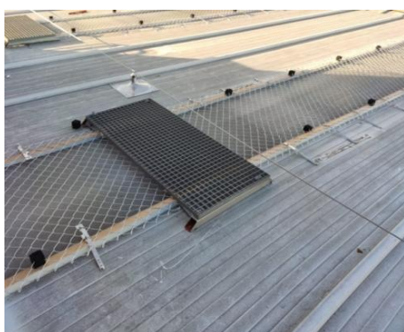
Fotografía 8. Borde perimetral de una cubierta protegido con barandillas. ( Proalt Ingeniería )