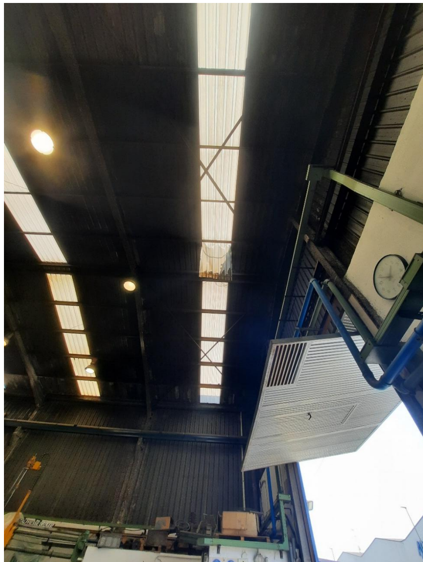
Fotografía 2. Vista interior de la nave donde se aprecia la placa translúcida por la que cayó el trabajador y los 9 metros de altura de la caída sufrida por este.

Según manifestaciones de su compañero de equipo, no se había percatado que conforme habían ido anclando soportes a la cubierta se habían aproximado a la siguiente placa translúcida existente en el sentido de avance de su tajo hasta que se produjo la caída de su compañero.