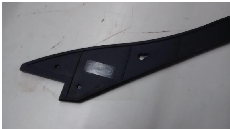
Fotografia 2. Empenyedor per a peces xicotetes que es desitgen tallar

Es pretenia serrar un element per a la disposició del rodapeu de grandària reduïda, amb forma rectangular i dimensions lineals de 12 cm x 13 cm. Per a això es va dur a cap el procediment següent: