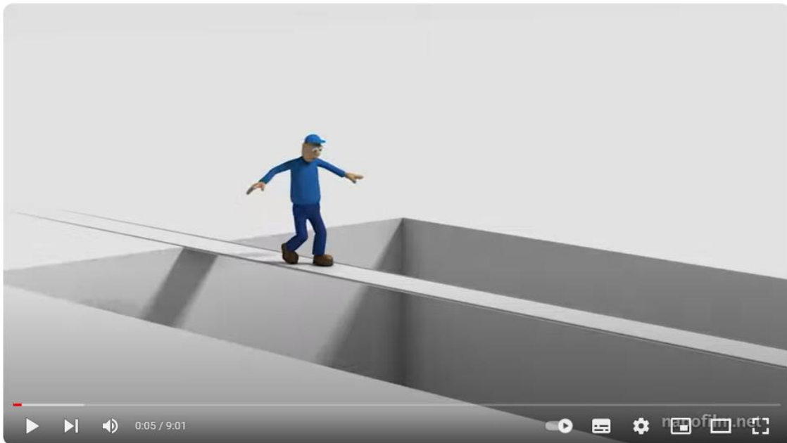
Napo en... trabajo en altura

Trabajos seguros y saludables en la era digital 2023-2025