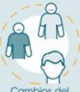
Cambios del estado anímico