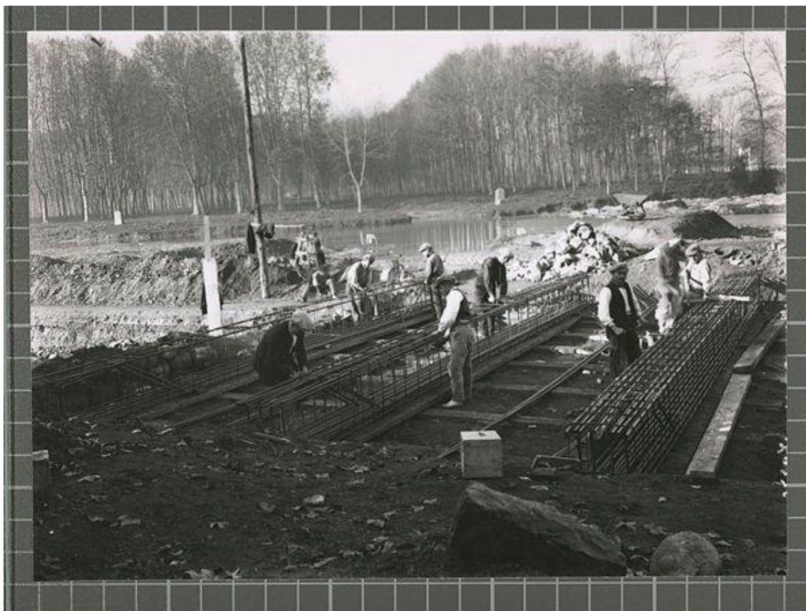
Construcció de la central elèctrica de Pedret. 1925. Ajuntament de Girona . Document compartit amb llicència Creative Commons BY-NC-ND .

Consulta la secció Memòria prevencionista del nostre portal