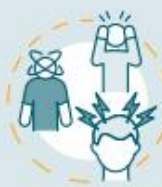
Dolores de cabeza