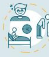
Problemas para dormir