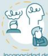
Incapacidad de concentración