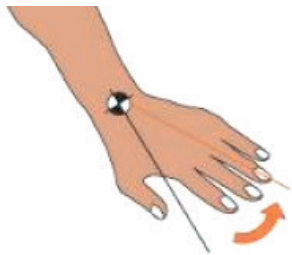
FIG. Desviación Ulnar o Cubital