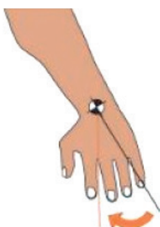
FIG. Desviación Radial