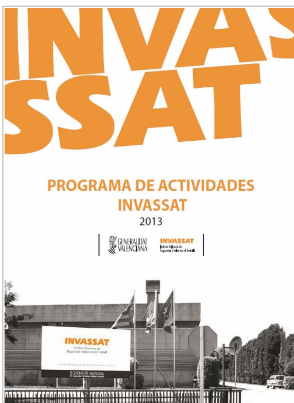
Programa de actividades del Instituto Valenciano de Seguridad y Salud en el Trabajo (INVASSAT) para 2013

[Descargar el documento en formato PDF. 2,6 Mb.]