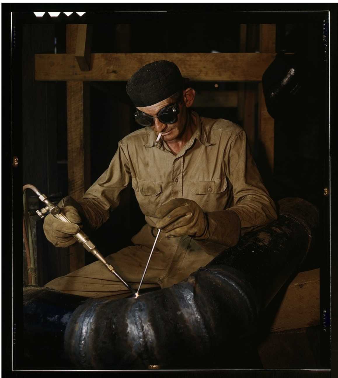
Alfred T. Palmer. Gas welding a joint in a line of spiral pipe at the TVA's new Douglas Dam on the French Broad River, Tenn. Soldador, Estados Unidos, 1942. Library of Congress . Sin restricciones conocidas de derechos de autor.